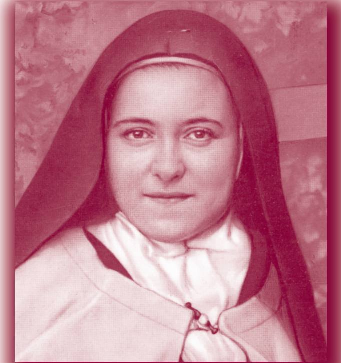
Diocesis De Arlington