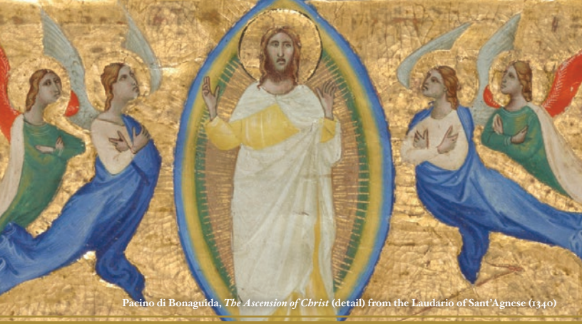
Pacino di Bonaguà, The Ascension of Christ (detail) from the Laudario of Sant'Agnese (1340)