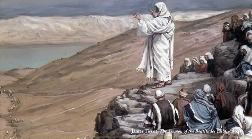
James Tissot, The Sermon of the Beatitudes (1886-1894)