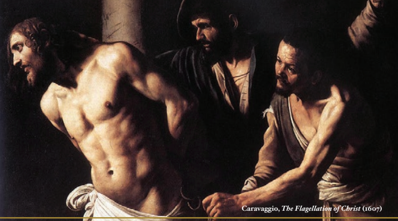
Caravaggio, The Flagellation of Christ (1607)