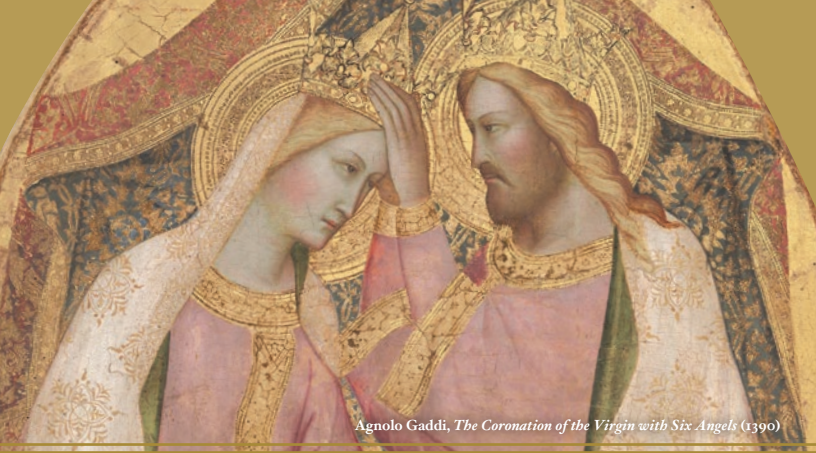
Agnolo Gaddi, The Coronation of the Virgin with Six Angels (1390)