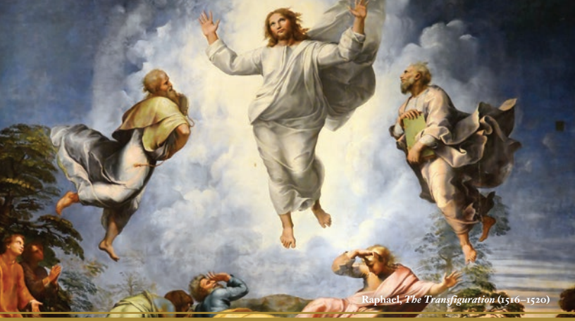
Raphael, The Transfiguration (1516–1520)