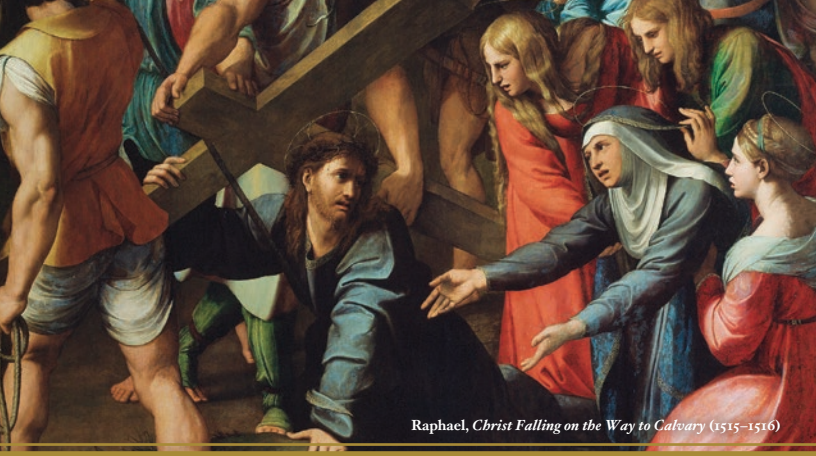
Raphael, Christ Falling on the Way to Calvary (1515–1516)