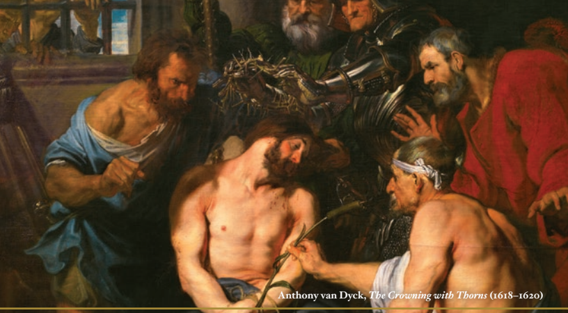
Anthony van Dyck, The Crowning with Thorns (1618–1620)