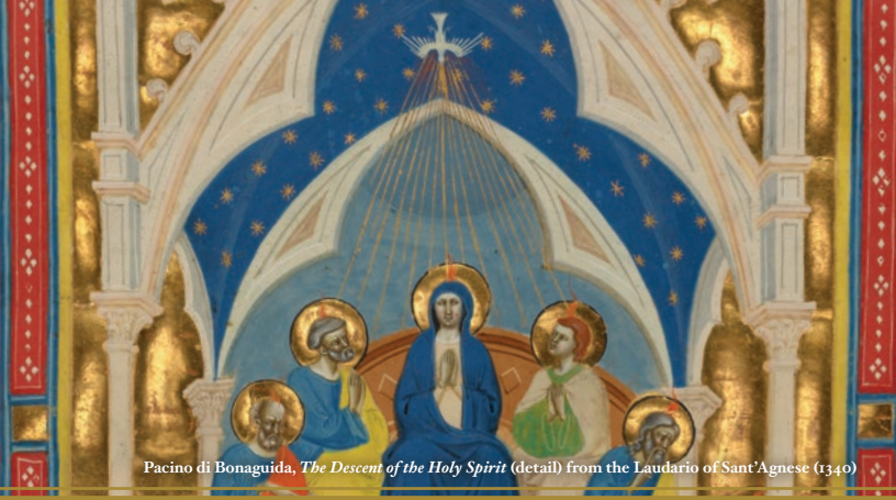
Pacino di Bonaguida, The Descent of the Holy Spirit (detail) from the Laudario of Sant'Agnese (1340)