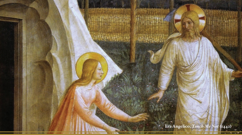
Era Angelico, Touch Me Not (1442)